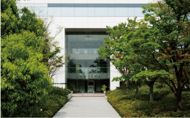
Pascal Produktionswerk in Oita, Japan