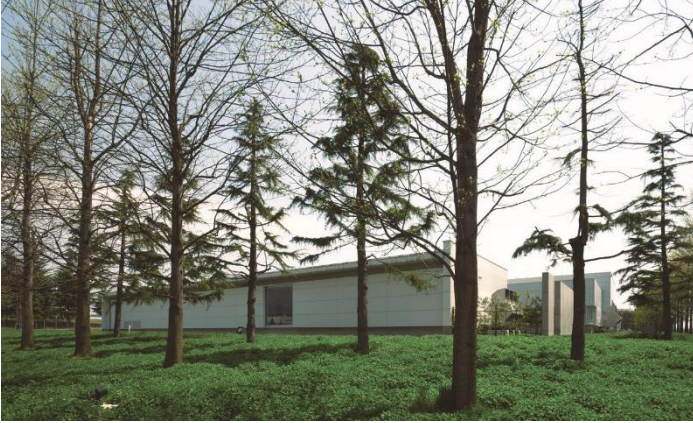
Pascal Produktionswerk in Dalian, China