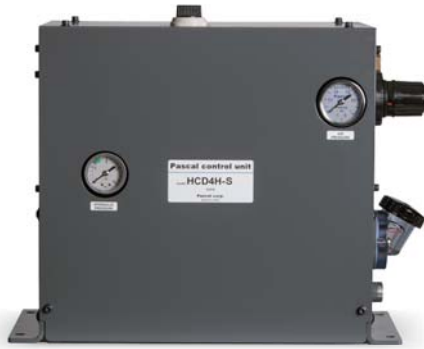
Steuermodul Typ HCD □ H-S

Dies ist ein druckluft- und handbetätigtes Hydrauliksteuermodul, in dem ein leckfreies Ventil, das Leckschutzfunktionen (absolut ölaustrittsfrei, für Hydraulikspanner unverzichtbar) aufweist, und eine Pascal-Pumpe miteinander kombiniert sind.